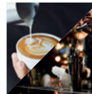
Kaffee Seminar / Cocktail Seminar