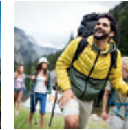
Wander- und Bergtouren