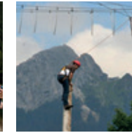
Big Swing / Flying Fox