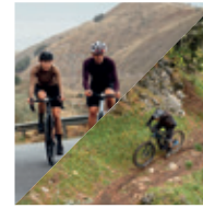
E-Bike MTB-Tour / Rennrad mit Guide