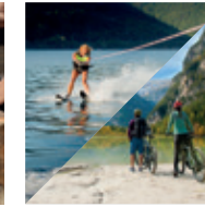
Wasserski / Kombi Bike & Beach