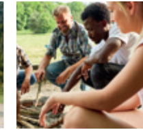
Outdoor Teambuilding / Alpenrallye